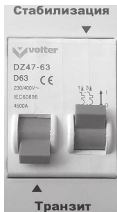
Мал.5. Режим «Стабілізація»

У разі аварійного зниження вхідної напруги контролер відключає всі силові ключі і знеструмлює навантаження. При підвищенні вхідної напруги підключення навантаження відбувається автоматично.