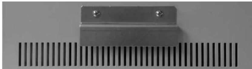
Мал.3. Упорна планка