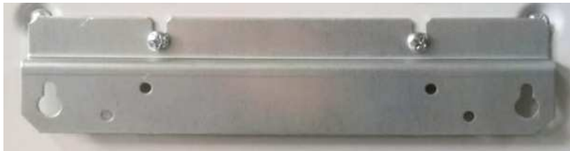
Мал.2. Кріпильна планка

Для зменшення габаритів і маси, виключення перегріву і спрацювання термозахисту при важких режимах роботи (повне навантаження, висока температура навколишнього середовища) стабілізатор оснащений системою примусового охолодження. Для виключення шуму, використовуються два вентилятора, які працюють на малих обертах.