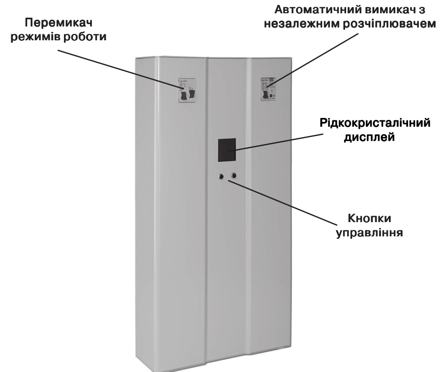
Мал. 1. Стабілізатор напруги Etalon-S.

У верхній частині розташований клемник, для підключення стабілізатора, закритий кришкою. Там же розташований заземлюючий контакт.