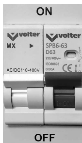
Мал.6. Автоматичний вимикач